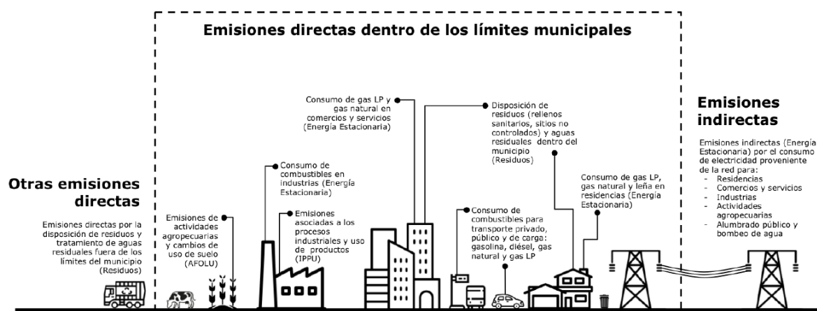
Figura 1. Alcances de las diferentes fuentes comunes de emisión que existen en los municipios.

Por último, el IMEGyCEI de Torreón calcula las emisiones a la atmósfera asociadas a las actividades de producción y consumo que tienen lugar dentro de los límites del municipio, así como aquellas emisiones que se generan fuera de los límites municipales pero que están asociadas a actividades que tienen lugar dentro del mismo (Figura 1).